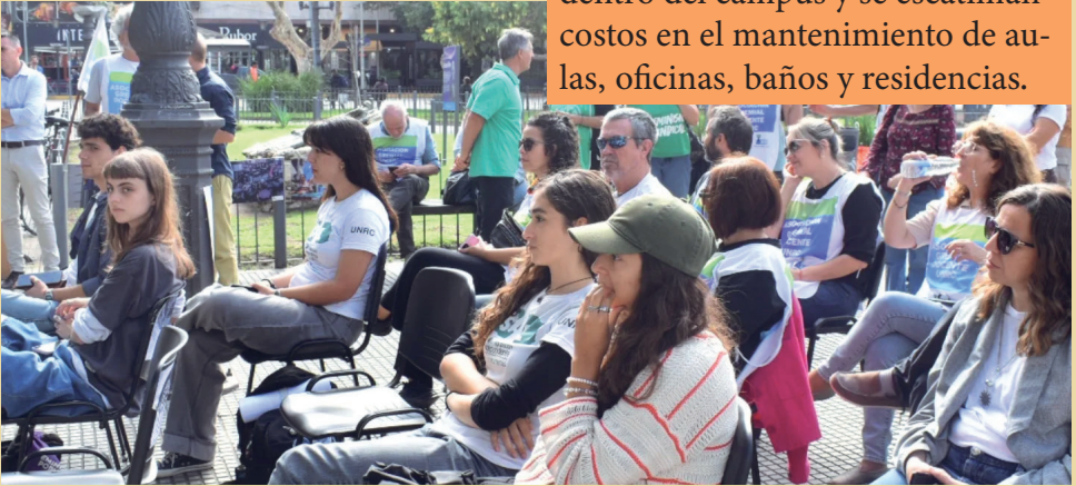
Carpa pública por la Universidad y la Soberanía, 17 de Abril de 2026

La pérdida de presupuesto impacta en las herramientas de trabajo de los estudiantes: insumos de baja calidad para los laboratorios y aulas, y la imposibilidad de reemplazar aquellos equipos que se rompan o pierdan. Asimismo, se paralizaron numerosas obras dentro del campus y se escatiman costos en el mantenimiento de aulas, oficinas, baños y residencias.