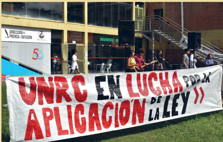
Festival estudiantil: UNRC en lucha, 9 de Abril de 2026

En un nuevo comienzo de año lectivo, las actividades universitarias de febrero y marzo transcurrieron a la par de un profundo plan de lucha por parte de los distintos claustros. Las medidas de fuerza responden al desfinanciamiento que están sufriendo todas las universidades nacionales desde hace tres años .